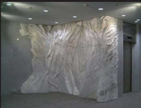
Passaggio candido(白天林) 2002 東京