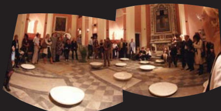
2007個展 スフラジオ教会 カラララ(イタリア)