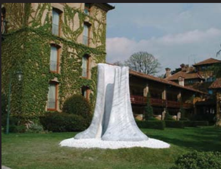
Nel Mio Interno(私の内に) 2000 プレーシャ(イタリア)