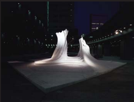
Passaggio(パッサジオ) 1995 大阪