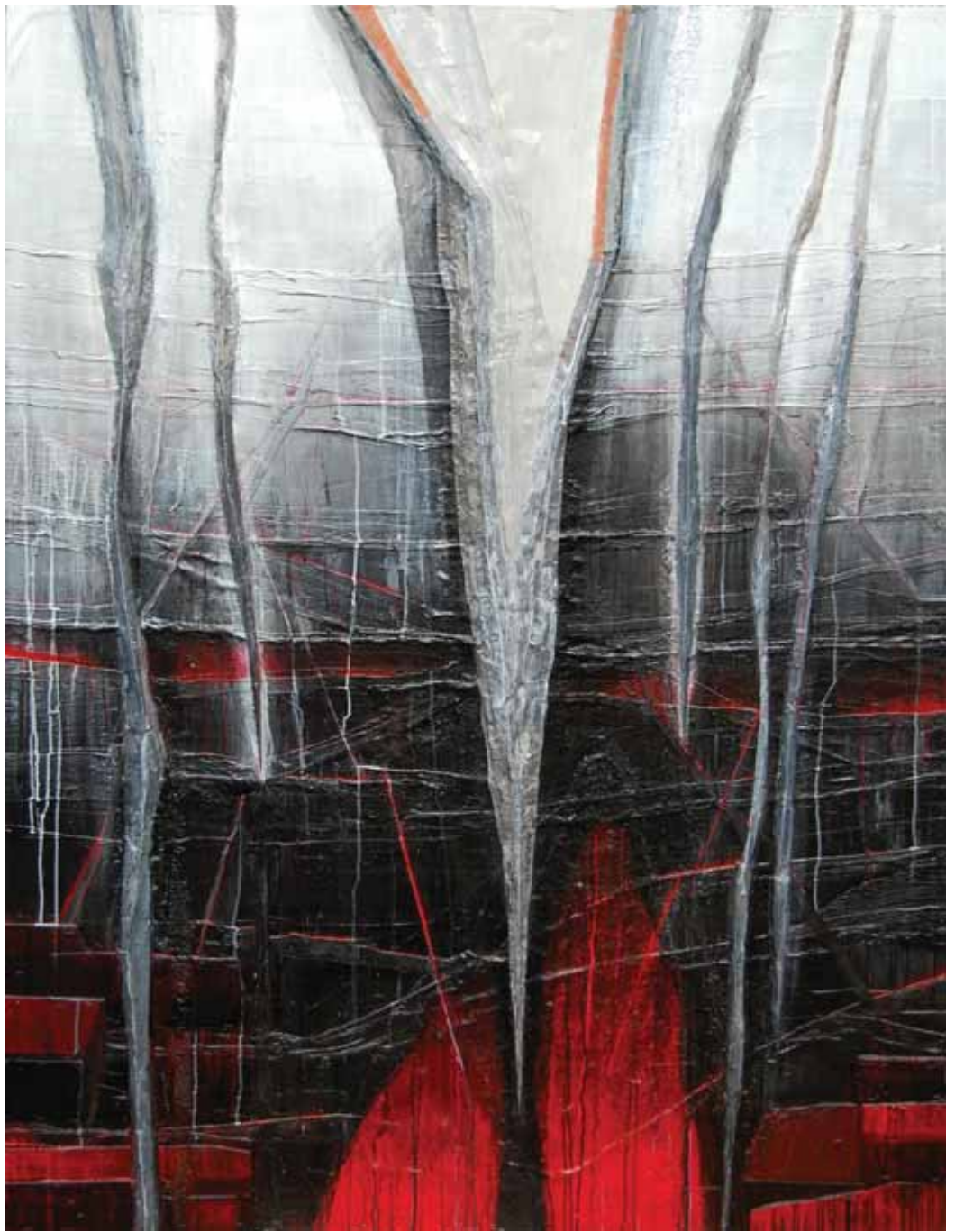
2007 METALRAIN 07-C

宇宙のエネルギーによって青い天体の全ての生命は生かされている。 地球上の現代社会の不条理に怒り、かなしみ、幸福の状態によるこび、歓喜する。 それは人間の持っている熱い心の表現である。 澄みきった大気が風になり、清水が湧き出し、岩肌をつたい河となって大地を巡る。 318年前、芭蕉はこの芦野の地でどの様な時空を感じ、奥の細道を歩んで行ったのか。